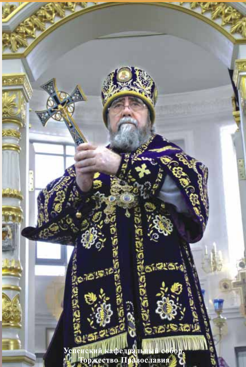
Успенский кафедральный собор. Торжество Православия

Владыка Владимир совершил чтение канона и чинопос-