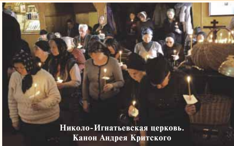
Николо-Игнатьевская церковь. Канон Андрея Критского