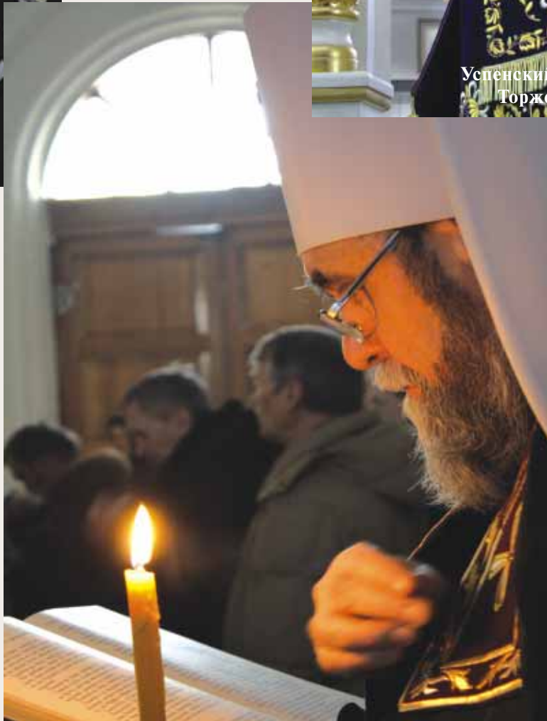
Собор Рождества Христова. Канон Андрея Критского