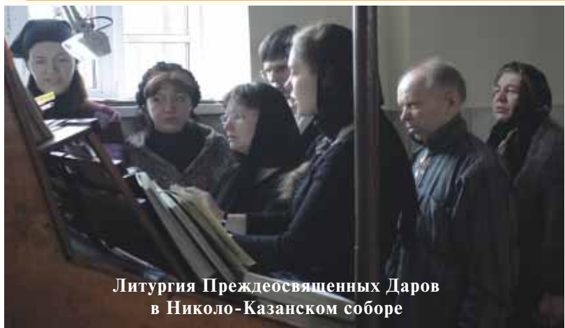
Литургия Преждеосвященных Даров в Николо-Казанском соборе