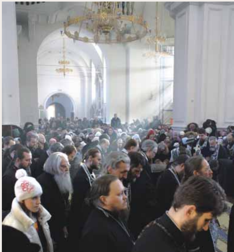
Успенский кафедральный собор. Прощеное воскресенье

На каждой службе Его Высокопреосвященство