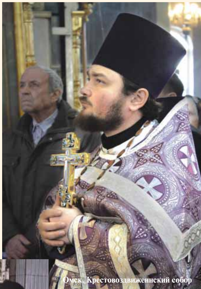
Омск. Крестовоздвиженский собор

- Да, окончил Киевскую духовную академию. Наверное, для любого человека студенческие годы самые счастливые. Киев - это удивительное место. Академия находится на территории Киево-Печерской Лавры между ближними и дальними пещерами. Встаешь,