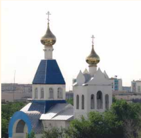
Учкудук. Храм Всех Святых, в земле Российской просиявших