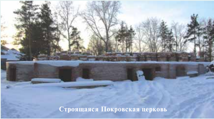
Строящаяся Покровская церковь