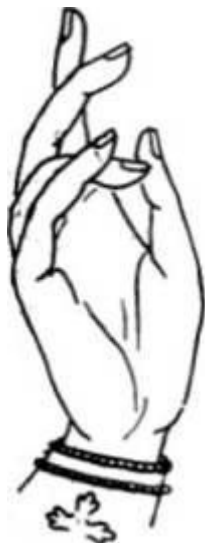
Рис. 2. Перстосложение при благословении верующих, совершаемое священником или архиереем.

БЛАГОСЛОВЕНИЕ – 1. Возглас священника или архиерея , к. – рым начинается богослужение. Различаются возгласы: литургийный («Благословенно царство...»); им же начинаются чин крещения и чин венчания), Всенощного бдения («Слава Святей...») и обычный («Благословен Бог наш...»); перед остальными богослужениями). 2. Осенение крестным знаменем