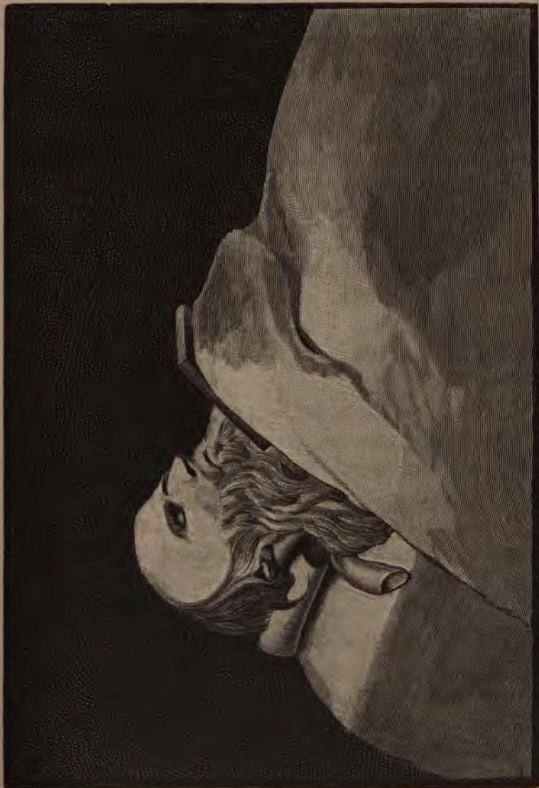
Великій рабъ Божій старецъ Феодоръ Кузьмичъ.