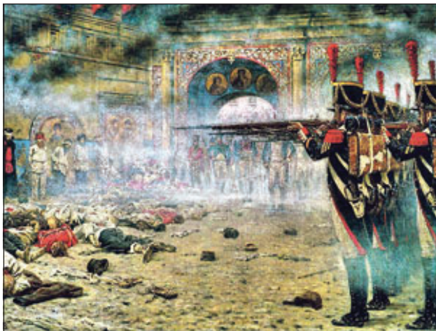
Народ и Церковь одинаково страдали от французской оккупации. В. Верещагин. В покоренной Москве (Поджигатели, или Расстрел в Кремле). 1897–1898. Государственный исторический музей

В некоторых дореволюционных учебниках война с Наполеоном именовалась Великой Отечественной. Позже это наименование перешло к другой Отечественной войне – с Гитлером в середине XX века. Как и в 1941 году, в 1812-м потребовалось сплочение всего народа. «В войне и везде, – писал в 1812 году московский генерал-губернатор Федор Ростопчин, – единодушные производит успех». Не осталась в стороне от патриотического порыва и Российская Православная Церковь.