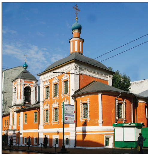
Храм свт. Николая в Клённиках