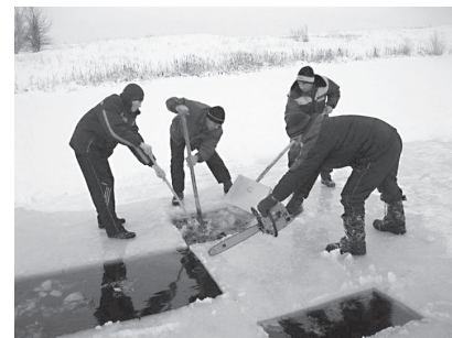
Идет приготовление Иордани