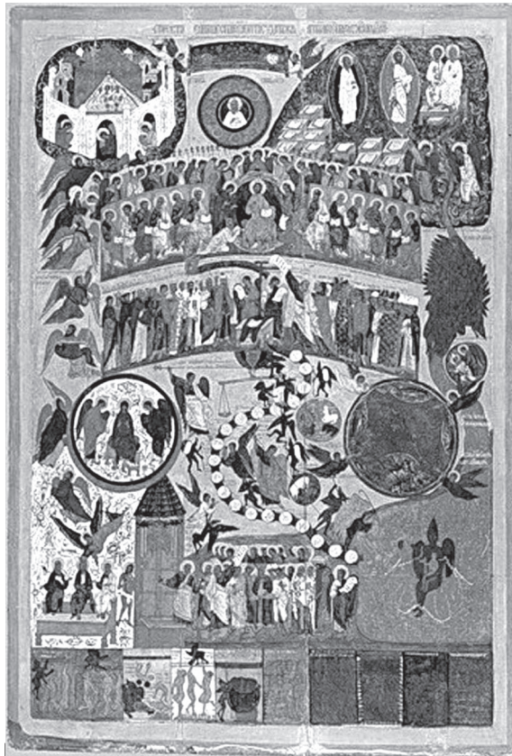
Икона «Страшный суд»

И звучат слова сегодняшнего Евангелия: «...если вы будете прощать людям согрешения их, то простит и вам Отец ваш Небесный; а если не будете прощать людям согрешения их, то и Отец ваш не простит вам согрешений ваших» (Мф. 6, 14-15). Простите всем всё и вся, и прощены будете. Простите, и спасены будете, и наследуйте рай.