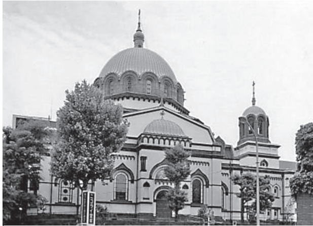
Собор Воскресения Христова в Токио