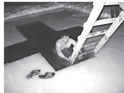
Традиционное купание в проруби. Смельчаков было много: и мужчин, и женщин, и детей»