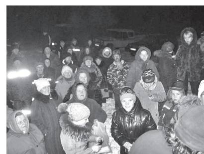
Молебен перед купанием