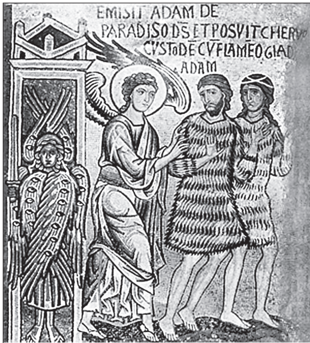
Икона «Изгнание Адама из Рая»

сесться к безвремению, к вечности». И так каждый день, каждый год.