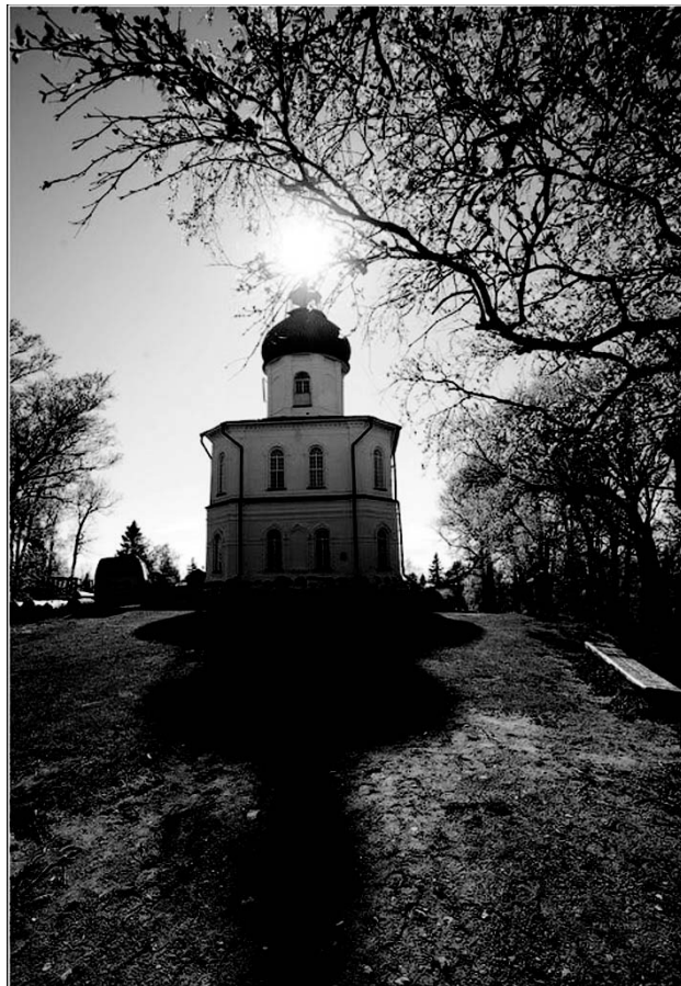
Церковь Вознесения Господня на Секирной горе

Немало испытаний преодолели иноки. Преподобный Зосима зимовал один, оставшись без съестных припасов. Непогода не