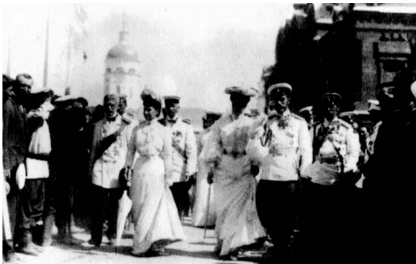
Саровские торжества. Государь с Августейшей фамилией

Саровские торжества - незабываемые дни для всех участников, дни, оставившие неизгладимый след в душе народной. Многие обрели веру, нашли утешение в скорбях, разрешение тяжелых недоумений и сомнений духа, указание доброго, истинного пути, ибо теплого молитвенника, великого предстателя и дивного чудотворца явил Господь людям Своим -