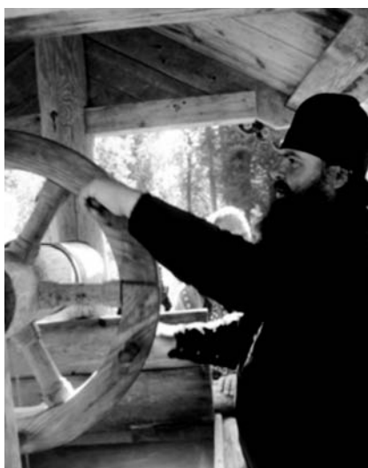
Колодец в Макарьевой пустыни