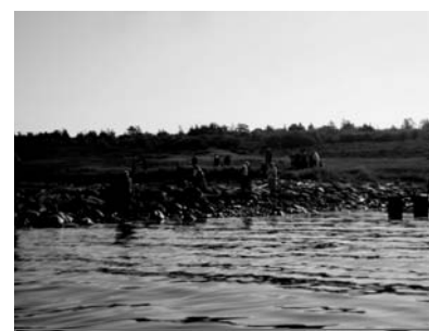
Высадка на о. Анзер