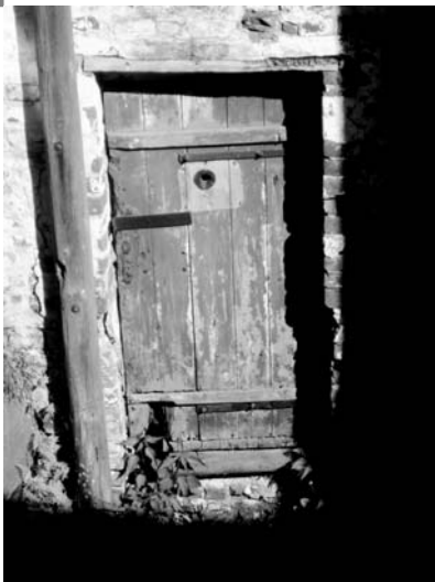
Камера заключенных времен Соловецкого лагеря