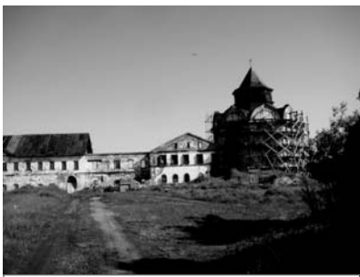
Троицкий скит на о. Анзер