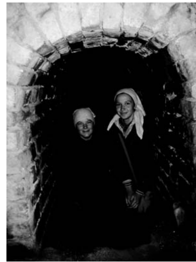
Подземелье Преображенского собора