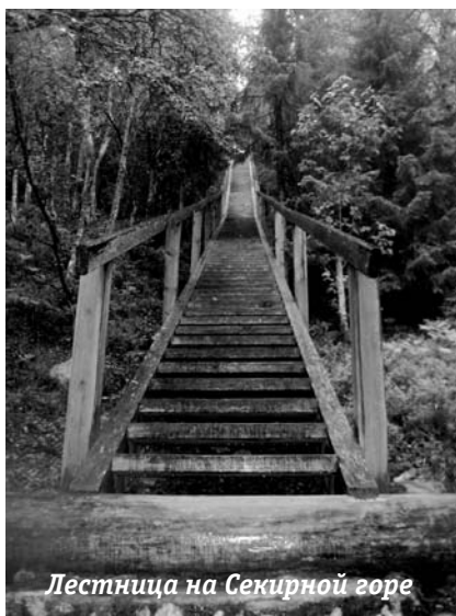
Лестница на Секирной горе

(Гулина Оксана) Самое страшное место Соловецкого лагеря - Секирная гора. Все знали Секирка - это смерть. Здесь заклю-