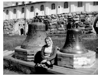
В монастырском дворе