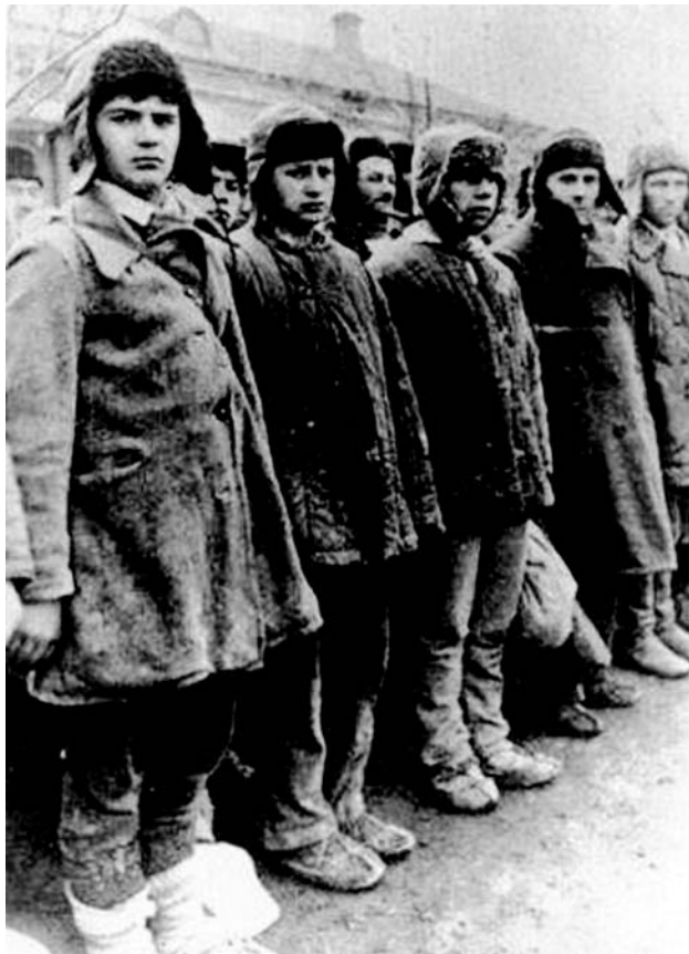
Заключенные Соловецкого лагеря

фоне темных, еще не заснеженных елей. Золотые маковки малых церквей высятся над окружающими их многобашенными стенами, теснятся к обгорелой громаде Преображенского собора. Он обезглавлен... Над усеченным куполом колокольни – шест; на нем – обвисший красный флаг.