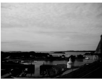
Корабельный ремонтный док