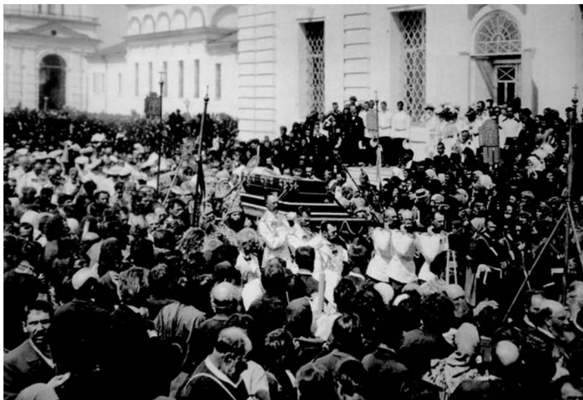
Крестный ход с мощами св. Серафима вокруг Успенского собора

А вечером следующего дня началось Всенощное бдение, имеющее особенное значение, - это первая церковная служба, на которой преп. Серафим стал прославляться в лике святых. При пении литийных стихир из Успенского собора направился крестный ход к церкви преп. Зосимы и Савватия Соловецких, где находился гроб преп. Серафима. Гроб поставили на носил-