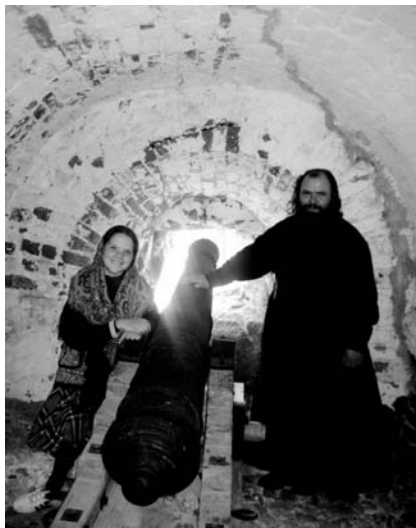
В крепостной башне