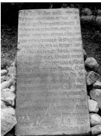
Каменная доска у подножия Секирной горы