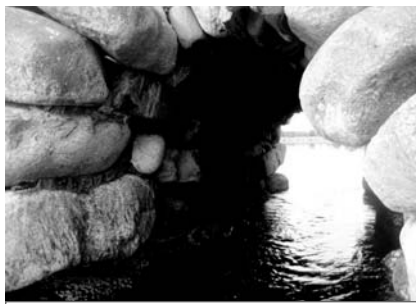
Дамба, соединяющая о. Соловецкий и о. Большая Муксолма