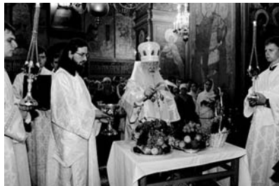
Освящение плодов в день Преображения Господня

на Успенский пост, но, начиная с этого дня, разрешается есть яблоки и фрукты, освящение которых проводится в конце праздничной литургии.