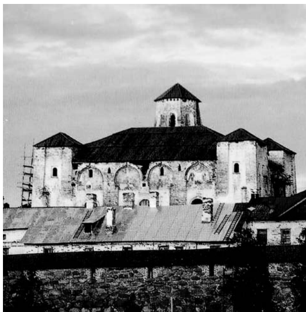
Преображенский собор времен лагеря

На носу парохода сотни каторжан сбились в плотный, вонючий, вшивый войлок. Мы еще не успели перезнакомиться, узнать друг друга. Среди втиснутой в трюм и на палубу тысячи лишь изредка мелькают знакомые лица. Вот мои сотоварищи по лежащему “купе” в “особом” вагоне, рядом с ними генерального штаба полковник Д., полурусский, полушвед, выпрямленный, подтянутый и здесь, а около него – ящик, самый обыкновенный деревянный ящик, но из него вверху торчит взлохмаченная голова, а с боков – голые руки. Это шпаненок, ухитрившийся на Кемском пересыльном пункте проиграть с себя все.