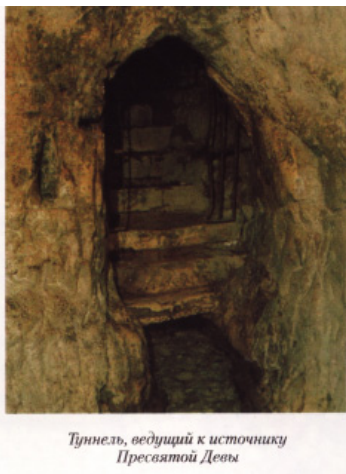
Туннель, ведущий к источнику Пресвятой Девы

"Торжество православной веры", ч. II, М., 2009