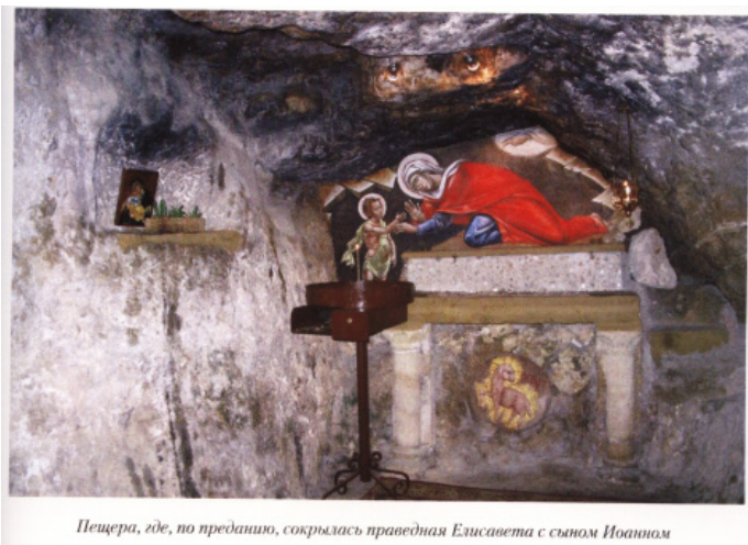
Пещера, где, по преданию, сокрылась праведная Елисавета с сыном Иоанном

Пещера, где, по Преданию, сокрылась праведная Елисавета с сыном Иоанном