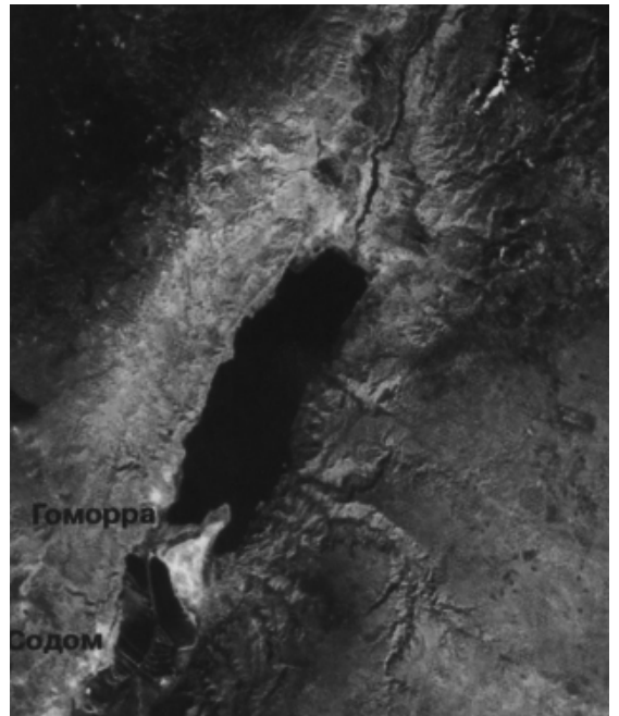
Мёртвое море. Аэрофотосъёмка

"Торжество православной веры", ч. 1, М., 2008