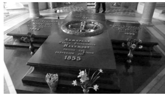
Усыпальница адмиралов - Свято-Владимирский собор, г. Севастополь

+++ Русский человек издревле присутствовал на территории Крыма. Крым является колыбелью великого русского Православия , и именно в Крыму крестился святой равноапостольный князь Владимир, в Крыму святые Кирилл и Мефодий проповедовали Евангелие, именно здесь создавалась славянская письменность. Русский народ Крыма дал нам огромный урок. Он показал, как оставаться верным Отечеству, когда, казалось бы, оно в упадке. Они своей верностью раздули огонёк национального чувства и у нас. Отождествление себя со всей многовековой историей государства - это и есть подлинное национальное самосознание. Этим великим событием воссоединения Россия восстановила себя как самостоятельную историческую личность с правом на собственный поиск