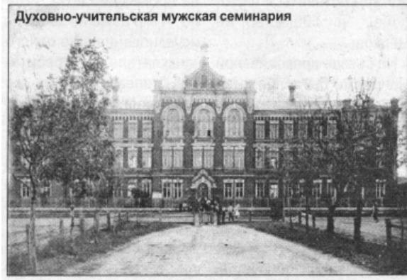
Духовно-учительская мужская семинария

Возвращаясь к вопросу подготовки молодых специалистов, необходимо подчеркнуть, что студенты должны не просто получать набор знаний по разным предметам, но и усваивать стройную систему представлений и взглядов на