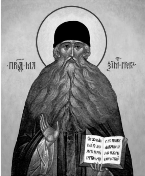
Преподобный Максим Грек

Грек был сыном богатого греческого сановника в городе Арте (Албания). Он изучал языки и науки в Венеции и Флоренции и получил блестящее образование. Приехав на Святую Гору Афон, он принял монашеский постриг. В 1518 году великий князь Василий III, пожелав разобраться в греческих рукописях и книгах своей матери, просил афонских старцев прислать учёного монаха для устройства библиотеки. По указанию Константинопольского патриарха в Москву отправили Максима. Для того чтобы пополнить библиотеку царя, он собрал переводческую группу для переписывания и перевода с греческого языка богослужебных и святоотеческих книг. Преподобный Максим перевёл на славянский язык толкования на Псалтирь, на книгу Деяний Апостолов и несколько богослужебных книг, впоследствии толкования Иоанна Златоуста на Евангелия от Матфея и Иоанна; писал он и собственные сочинения. По своей простоте, преподобный, вида неустрой-