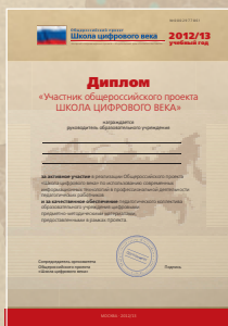
Диплом руководителю образовательного учреждения