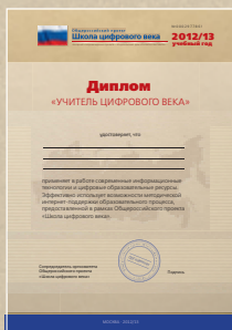
Диплом педагогическому работнику