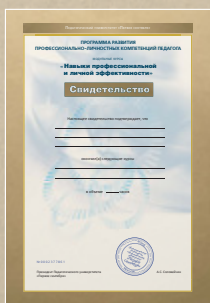
Свидетельство о прохождении Программы развития профессионально- личностных компетенций педагога