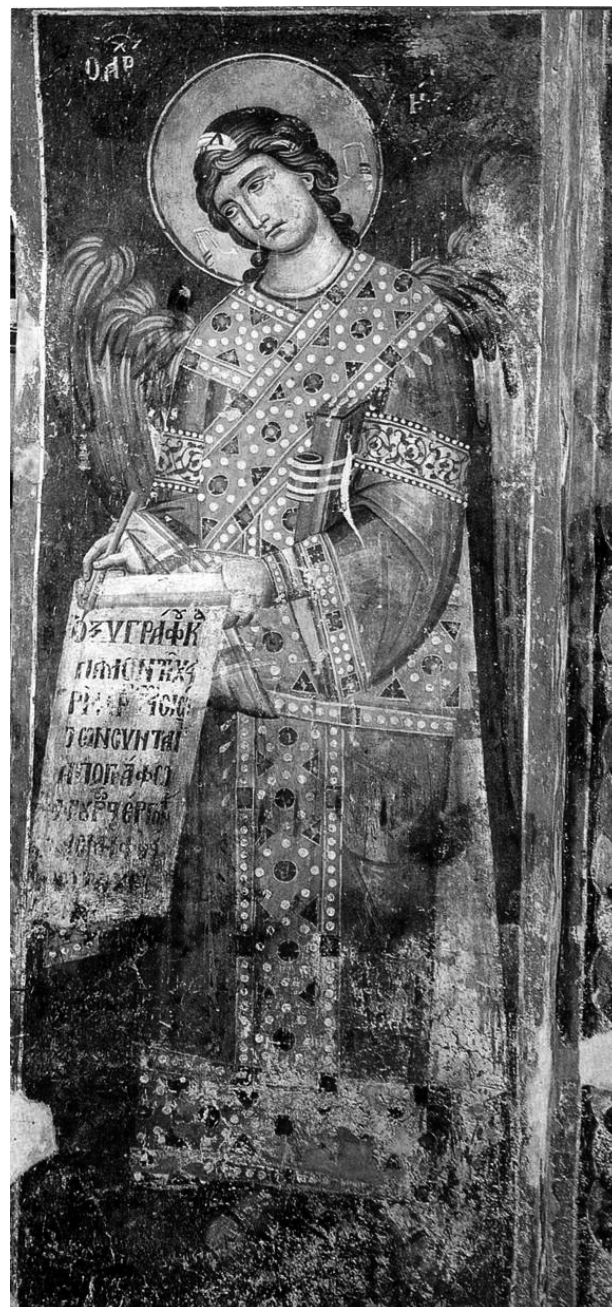
Ангел, записывающий поведение молящихся в храме. Фреска ц. Богородицы Перивлепты в Охриде. 1295 г.

Проскомидия завершается каждением храма, что символизирует благодать Божию изливаемую на все человечество в таинстве Евхаристии. Во время каждения, нужно дать возможность священнослужителю беспрепятственно кадить все иконы в храме и молящихся. По традиции верующие должны обратиться лицом к совершающему каждение и приклонить голову, не налагая при этом крестное знамение. В любом случае недопустимо разворачиваться спиной к алтарю, но стоять к кадящему в вполоборота.