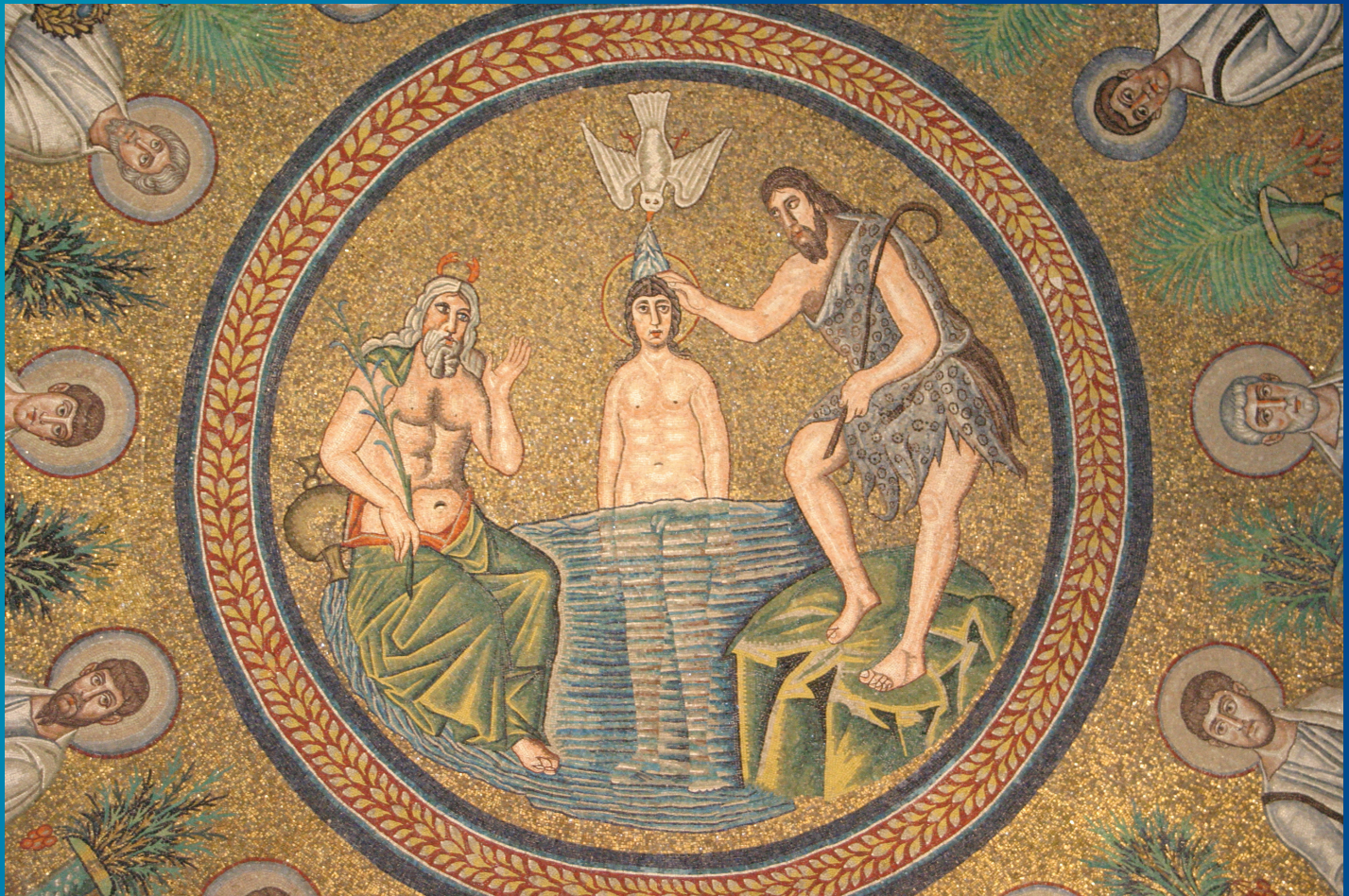
Крещение. Мозаика купола баптистерия. Равенна. V век