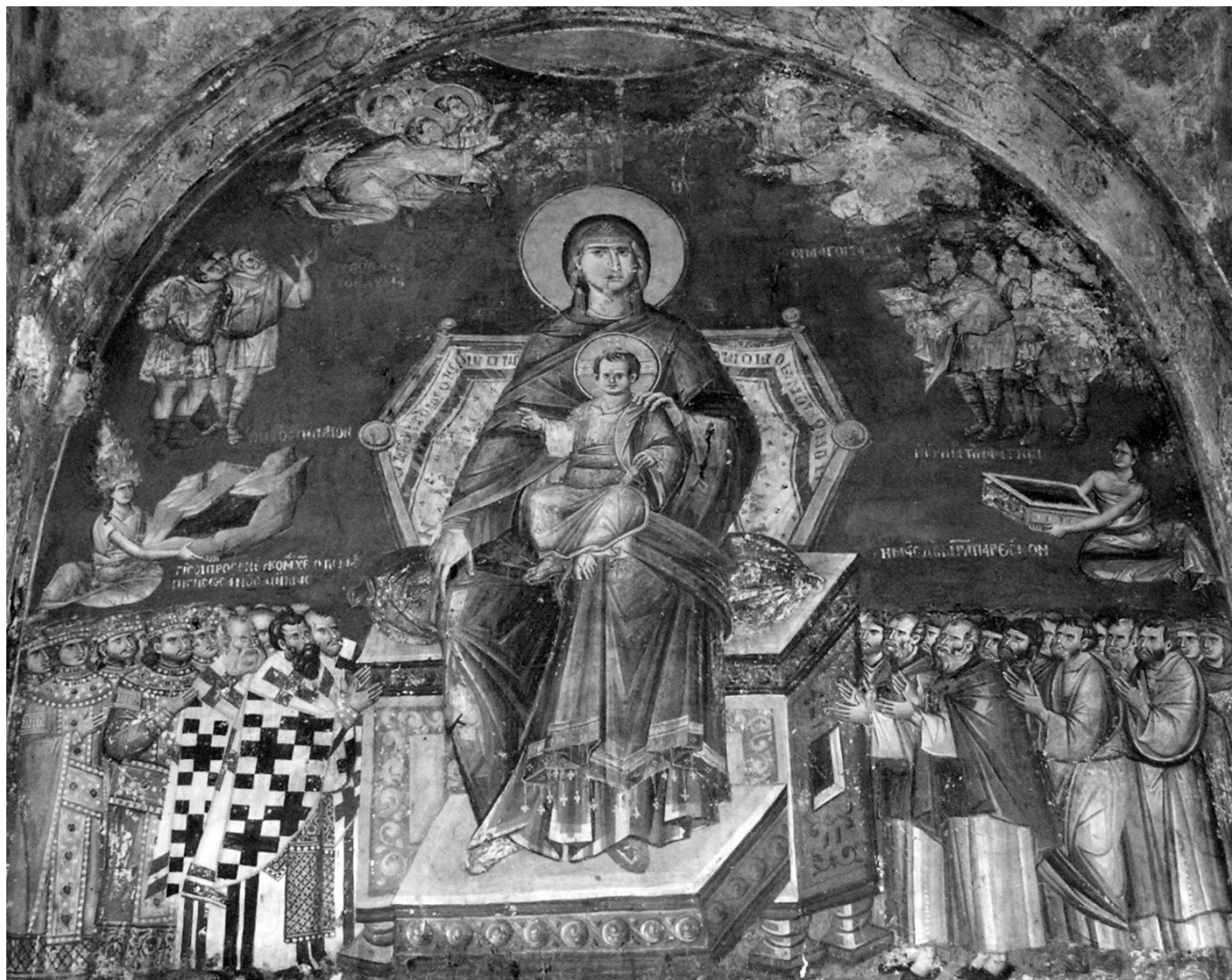
Рождественская стихира. Фреска церкви Богоматери Перивлепты в Охриде. 1295 год

те!», с благоговением и трепетом поспешим прикоснуться к тайне Боговоплощения.