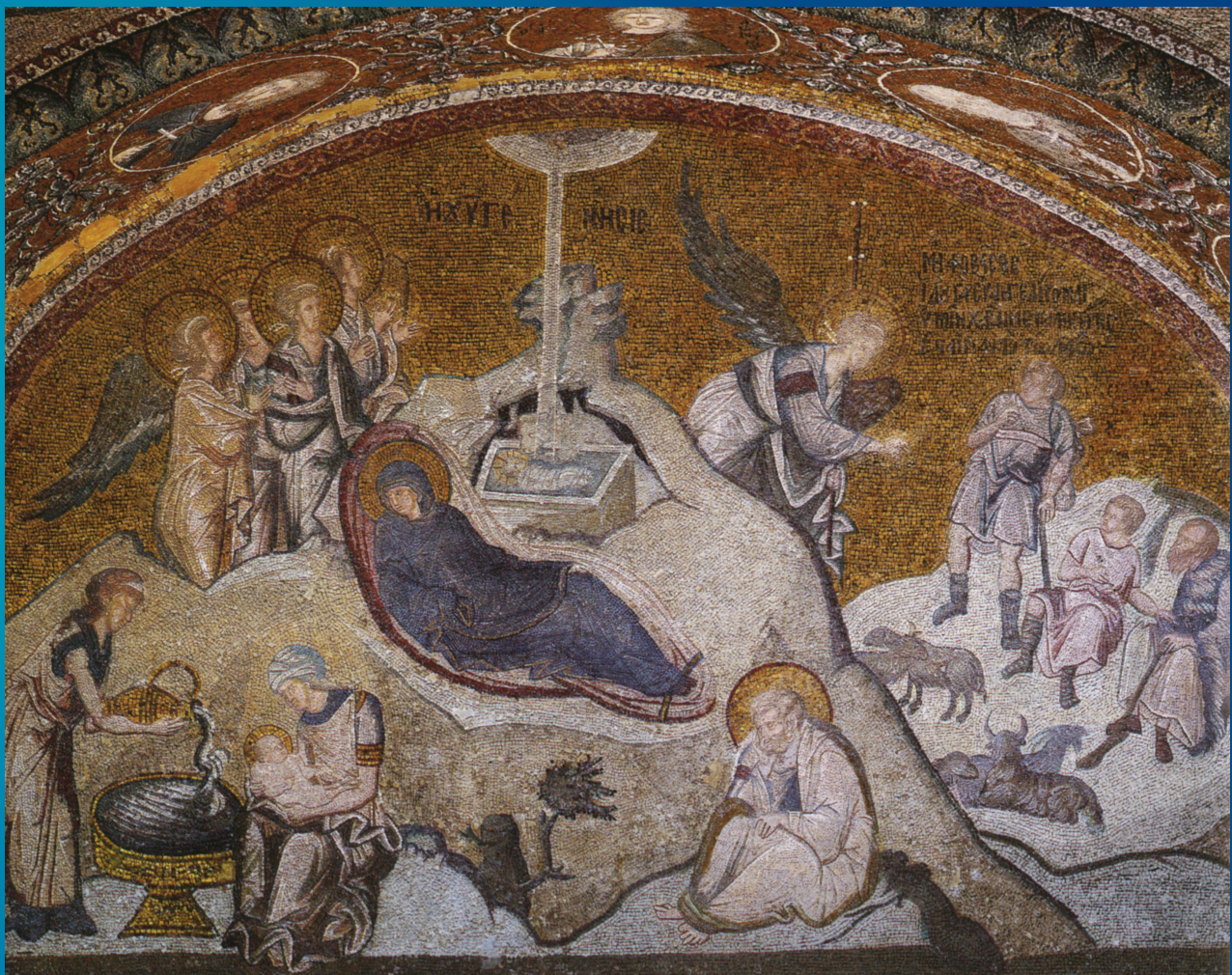
Рождество Христово. Мозаика монастыря Хора в Константинополе. Около 1318 г.