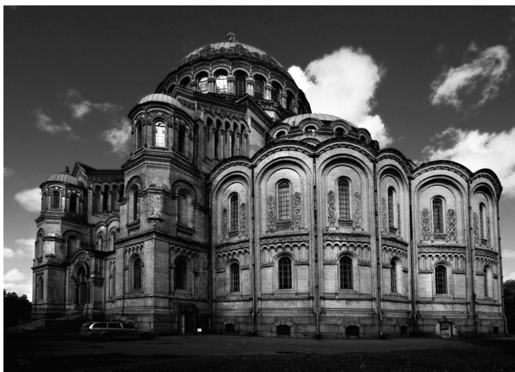
Никольский собор в Кронштадте. На его основание в 1903 г. св. Иоанн совершил молебен

Отец Иоанн находился в царском дворце в Ливадии при последних днях жизни императора Александра III, и самая кончина государя последовала в его присутствии. Больной государь встретил отца Иоанна словами: «Я не смел пригласить Вас сам. Благодарю, что Вы прибыли. Прошу молиться за меня. Я очень недомогаю». Это было 12 октября 1894 года. После совместной коленопреклоненной молитвы государя наедине с отцом Иоанном последовало значительное улуч-