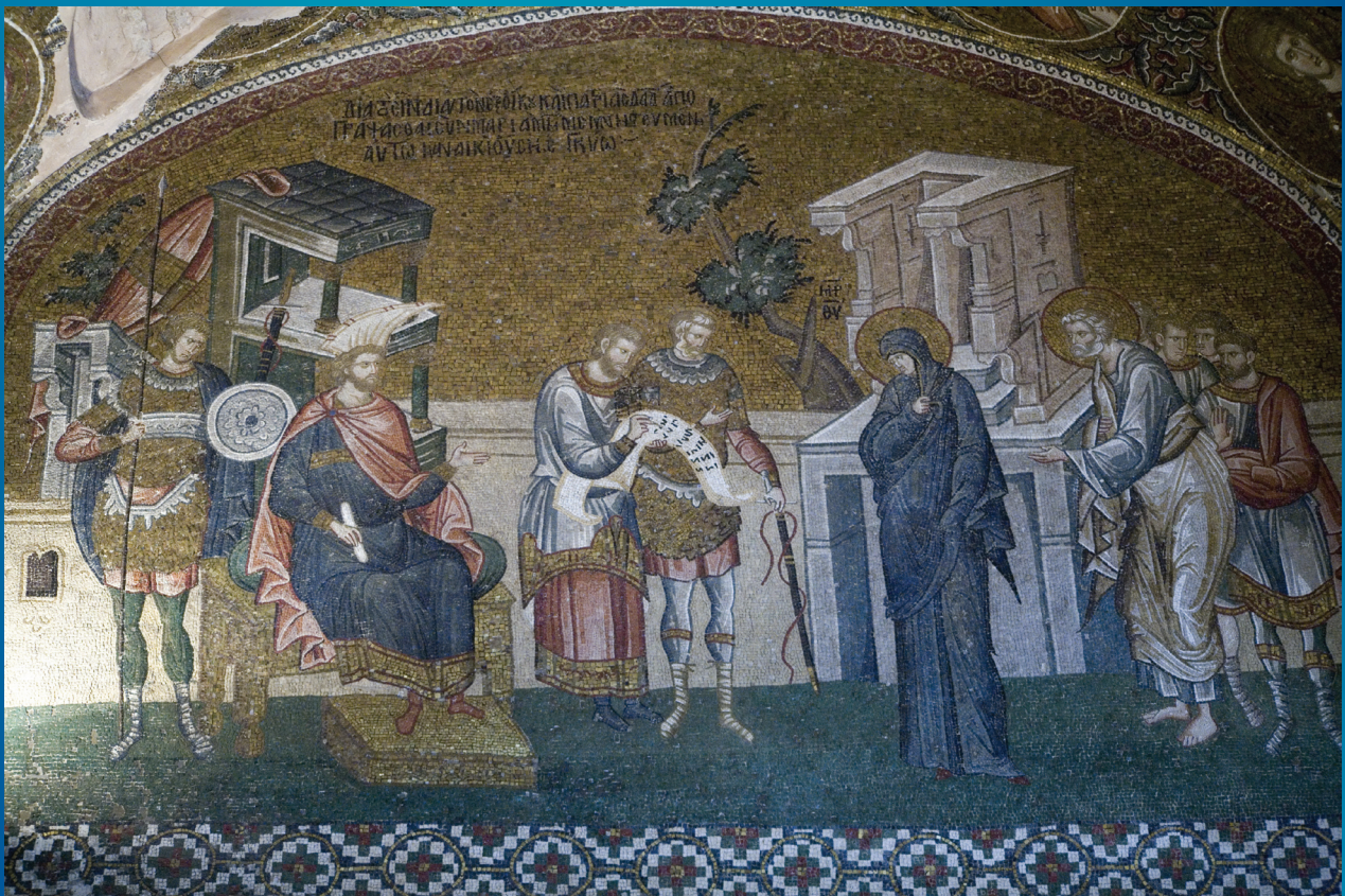
Мария и Иосиф в Вифлееме на переписи населения. Мозаика монастыря Хора. Около 1318 года