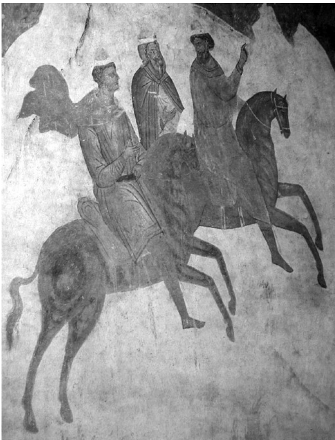
Волхвы. Фреска в Ферантово. Дионисий. 1502 год

Рождество Христово — событие всемирно-исторического значения, изменившее ход человеческого бытия. Бог, будучи премудр и всеблаг, после грехопадения не оставил человека на безвозвратную гибель, но предопределил спасти