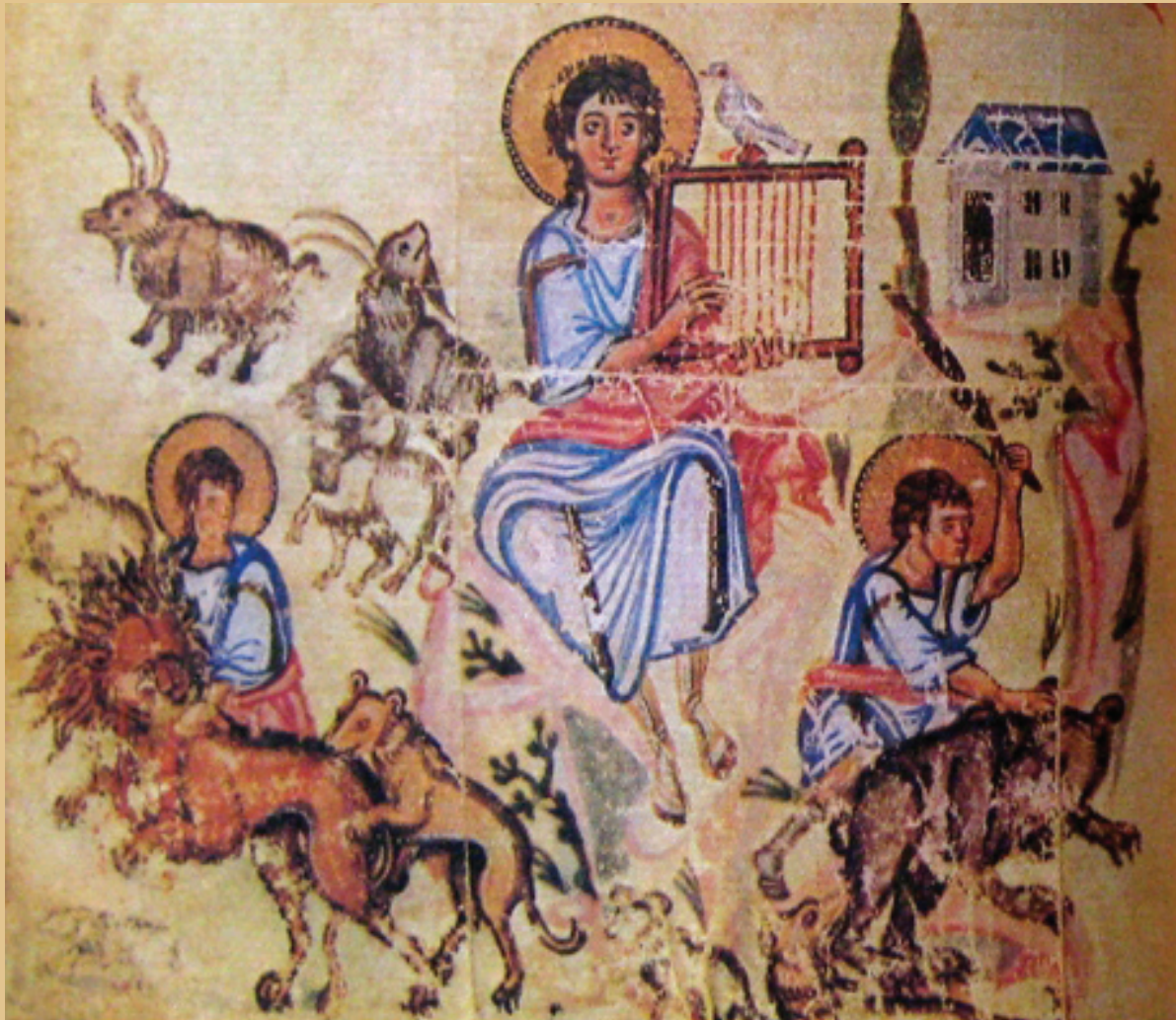
Давид играет на псалтири. Миниатюра Худовской Псалтири. IX век

Это вызвало в царе Сауле ревность и от этого времени он, от которого отступил Дух Господень, мучился завистью и унынием.