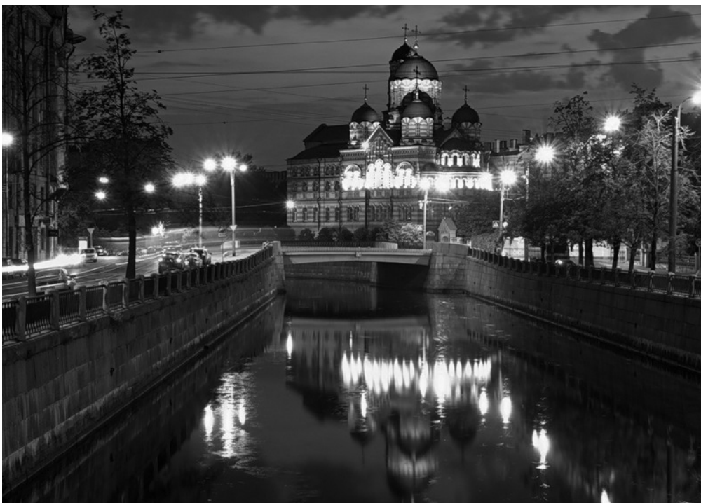
Монастырь св. Иоанна Рыльского в Петербурге

Прославлен святой праведный Иоанн Кронштадтский Поместным Собором Русской Православной Церкви в 1990 году. Память празднуется 20 декабря, а также в 3-ю Неделю по Пятидесятнице – в Соборе Санкт-Петербургских святых.