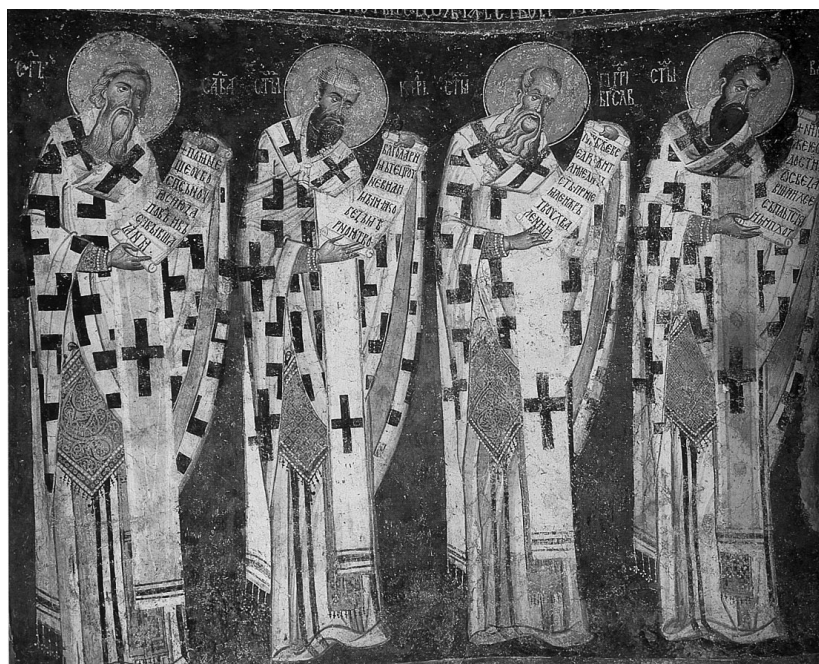
Служба св. отец. Храм св. Апотолов в Печке Патриаршей. Сербия, XIII век

Как мы видим, к поминовению людей изначально относились в Церкви особенно. Евхаристическое сознание связывало с освящением Даров не только благодарение, но и ходатайство за живых и усопших, что, несомненно, отражает глубину Церковного осознания Христовой Жертвы, принесенной Им за весь человеческий род во искупление и спасение верных.