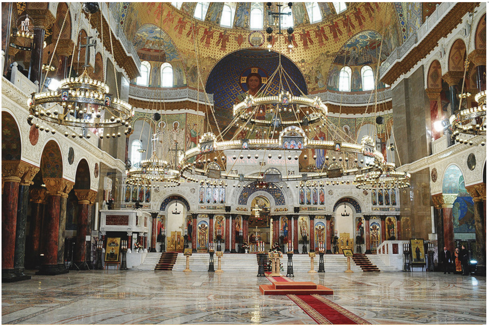
Интерьер Никольского собора в Кронштадте.