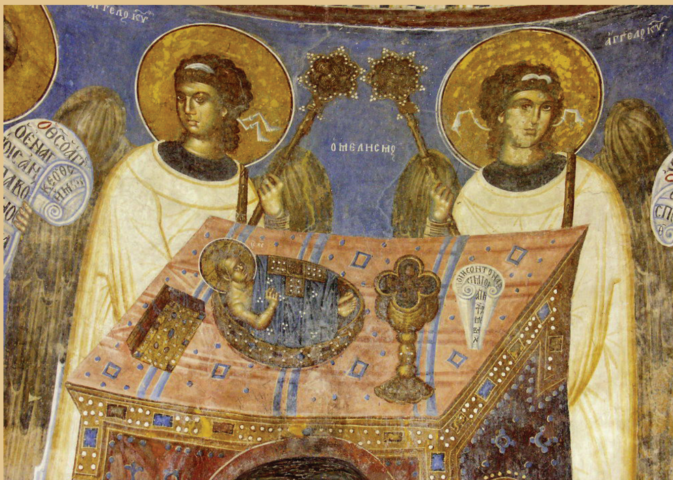
Освящение Св. Даров. Фреска Маркова монастыря в Македонии. Нач. XIV века