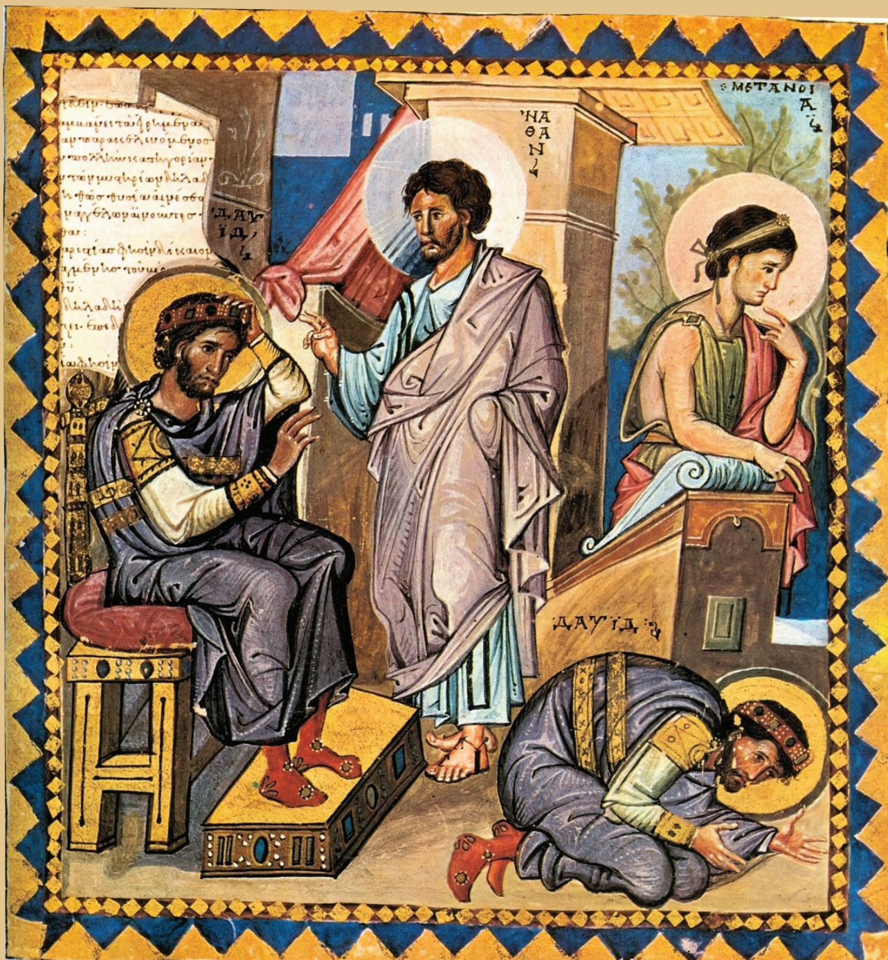
Пророк Нафан обличает Давида. Миниатюра Парижской Псалтири. X век