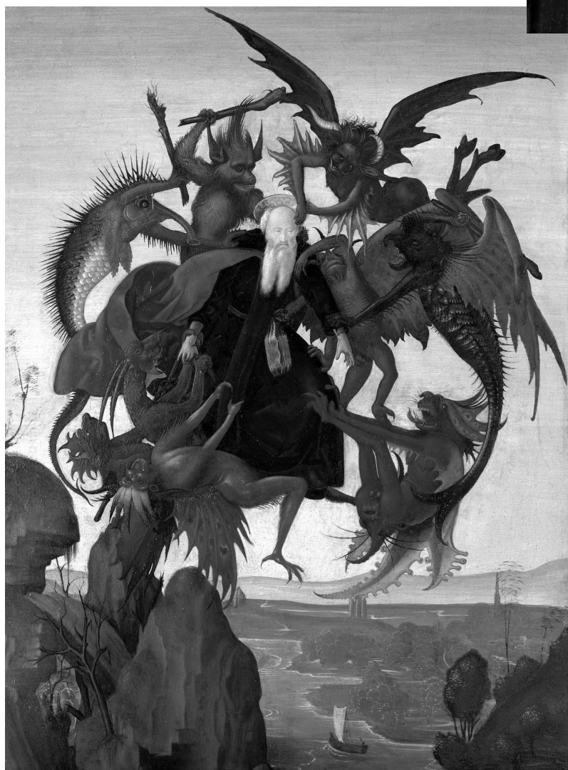
Микельанджело Буонарроти? Испытание св. Антония

и устремления так, что он ощущал одну лишь потребность в единении с Богом.