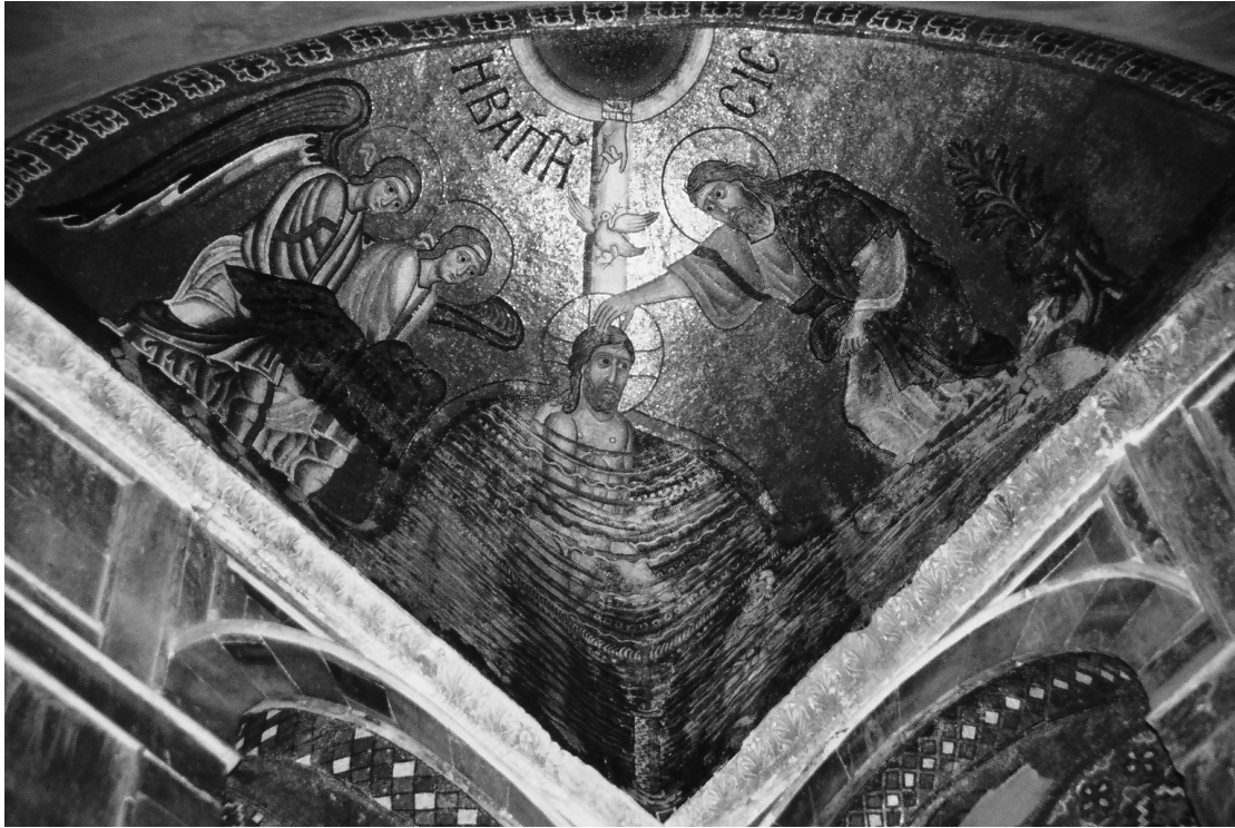
Крещение. Мозаика монастыря Осиас Лукас в Фокиде. Греция. 1030-е годы

и обратился к ним с проповедью о приближении Царства Небесного: «покайтесь, ибо приблизилось Царство Небесное» (Мф. 3,2), подразумевая под Царством Небесным пришествие Христово. Проповедь его о Грядущем Искупителе была настолько сильна, вдохновенна и убедительна, что множество народа откликнулось на этот призыв праведника и поспешило на берег Иордана, помышляя «в сердцах своих об Иоанне, не Христос ли он» (Лк. 3,15). Сам же он говорил о себе как о Предтече, то есть о том, кто предшествует Спасителю: «я глас вопиющего в пустыне: исправьте путь Господу...» (Ин. 1,23). Приуготовление же пути, в первую очередь, означало приведение людей к покаянию и исправлению. Призывая людей осознать свои грехи и творить «достойный плод покаяния» (Мф. 3,8), Иоанн умягчал их жестокосердие, подготавливал соплеменников к проповеди грядущего вслед за ним Господа Иисуса Христа. «Тогда Иерусалим и вся Иудея и вся окрестность Иорданская выходили к нему и крестились от него в Иордане, исповедуя грехи свои» (Мф. 3,5-6). Те из них, кто раскаивался в своих грехах, в знак очищения принимали от Иоанна погружение в воды Иордана. Это и было крещение (погречески слово происходит от глагола «баптизо» – погружать). Иоанн крестил крещением покаяния, которое символизировало обретение чистоты и освобождение от греха после принесения чистосердечного раскаяния. Крещение Иоанново имело своим назначением не телесное очищение, а было призывом к покаянию, увещанием бро-