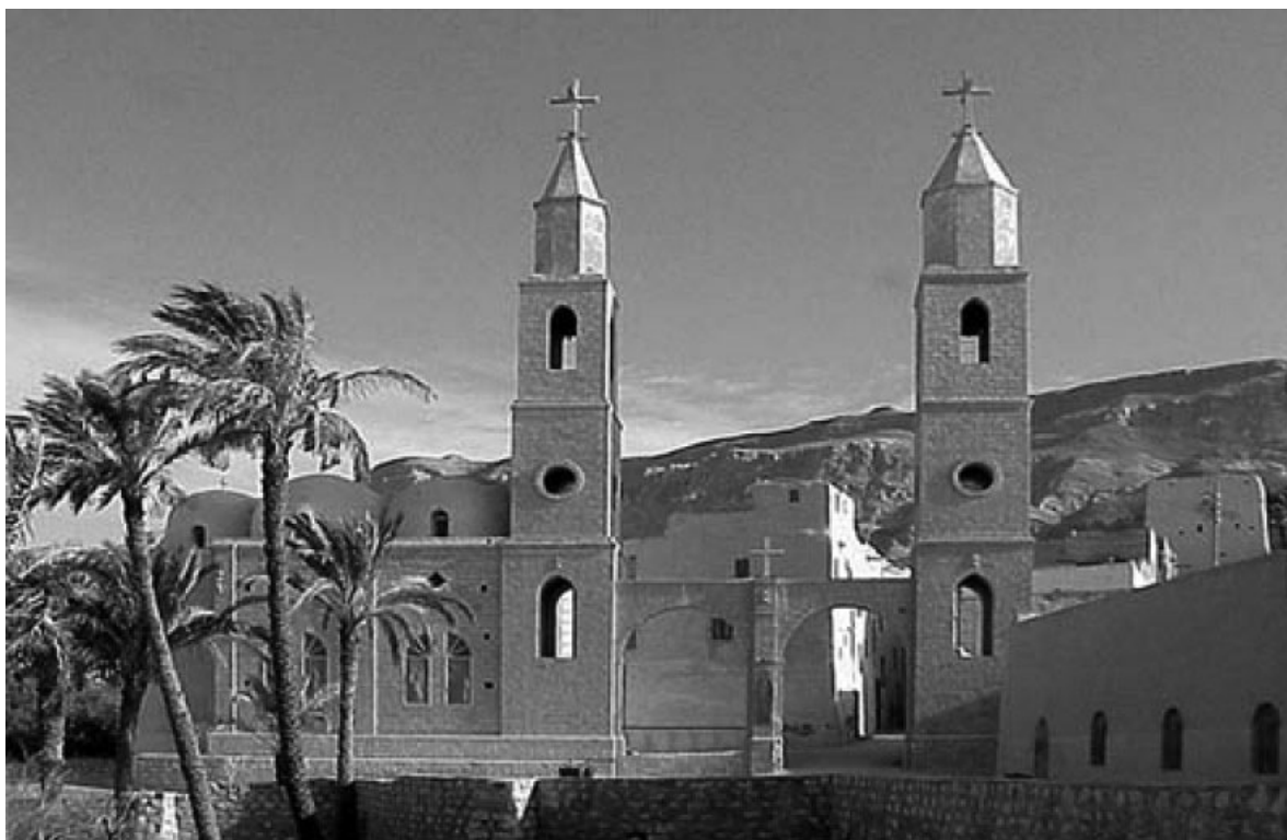
Монастырь св. Антония

В пустынном уединении святой Антоний провел в общей сложности 85 лет своей жизни. О своей предстоящей кончине святой заблаговременно предупредил учеников. Он дал им последние наставления, просил не хоронить его с почестями и мирно скончался в 356 г. на 105 году жизни. Согласно его завещанию, он был похоронен учениками в тайном месте.