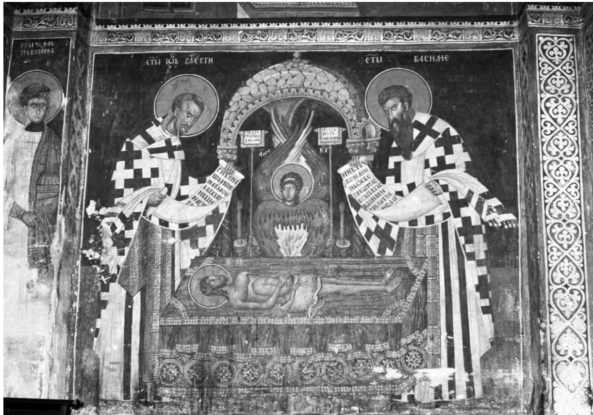
Св. Василий Великий и Иоанн Златоуст служат литургию. Фреска монастыря Дечаны в Косово. 1340 г.

приняв особое последование, совершающееся до Литургии и совершенно отдельно, без участия в нём мирян. Поэтому-то миряне зачастую не понимают его значения и не чувствуют его смысла.