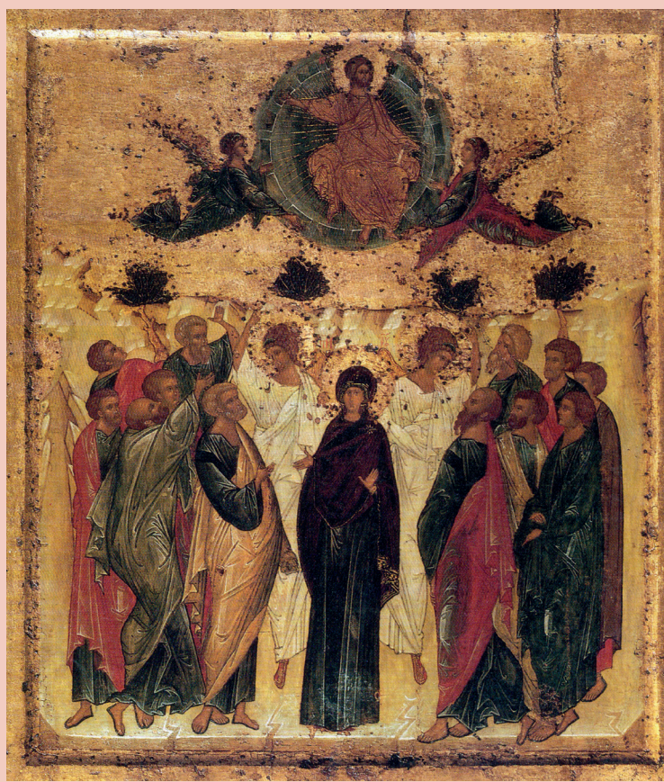
Преп. Андрей Рублев. Икона из иконостаса Успенского собора во Владимире. Около 1408 года