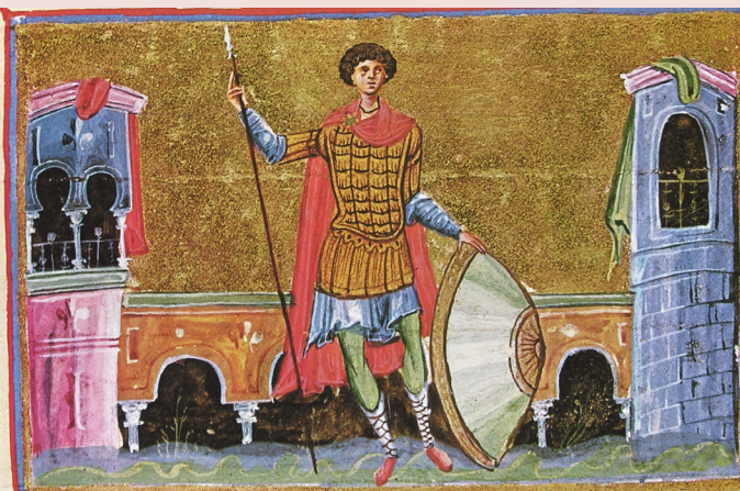
Св. Георгий. Миниатюра Евангелия. XI век

Над выпуском работали: дизайн и верстка Владимир Бабич, редакторы- Елена Саенкова, Ольга Лисицина