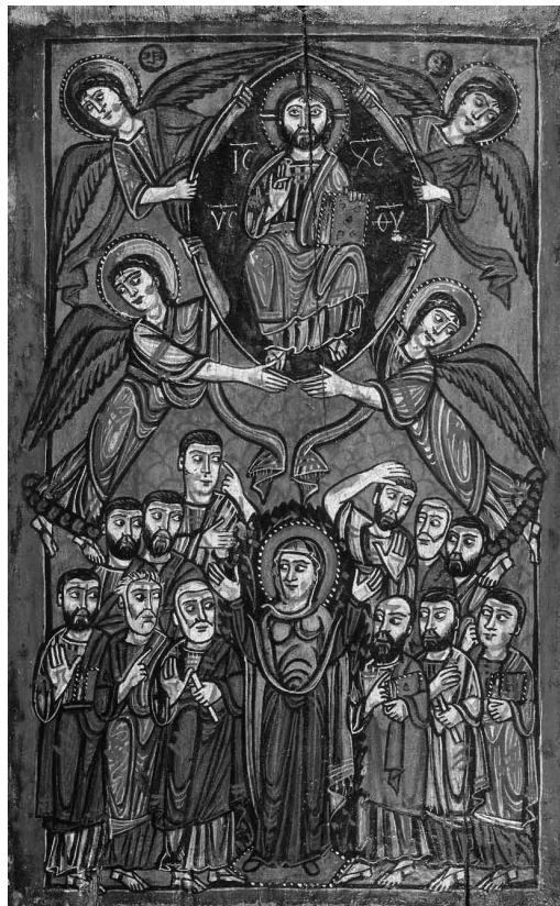
Икона из монастыря св. Екатерины на Синае. IX век

Если величавая фигура Богоматери словно олицетворяет торжественность момента, то полную противоположность ей составляют две группы сбившихся вместе апостолов, удивленно беседующих друг с другом и смотрящих в небо на возносящегося Христа. Среди апостолов особо выделены Петр и Павел, которые взирают на Богоматерь. Петр, словно вопрошая о грядущих событиях, протягивает к Ней руку. Этот диалог Богоматери и Петра об устройении Церкви благословляет Христос – жест его правой руки расположен прямо над руками Богоматери и Петра. Такое композиционное решение глубоко символично.