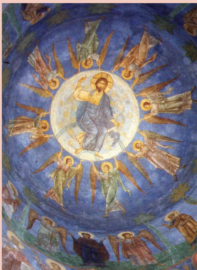
Фреска Спасо-Преображенского собора Мирожского монастыря во Пскове. Середина XII века