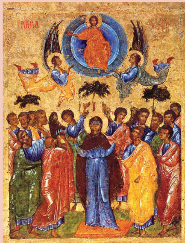
Икона из иконостаса Св. Софии Новгородской, 1341 год