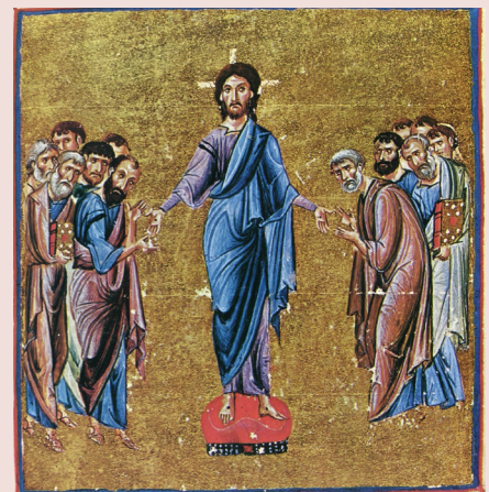
Благословение на проповедь