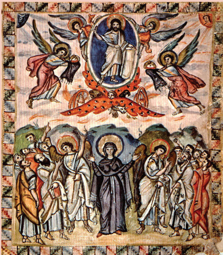
Миниатюра Евангелия Равулы. VI век