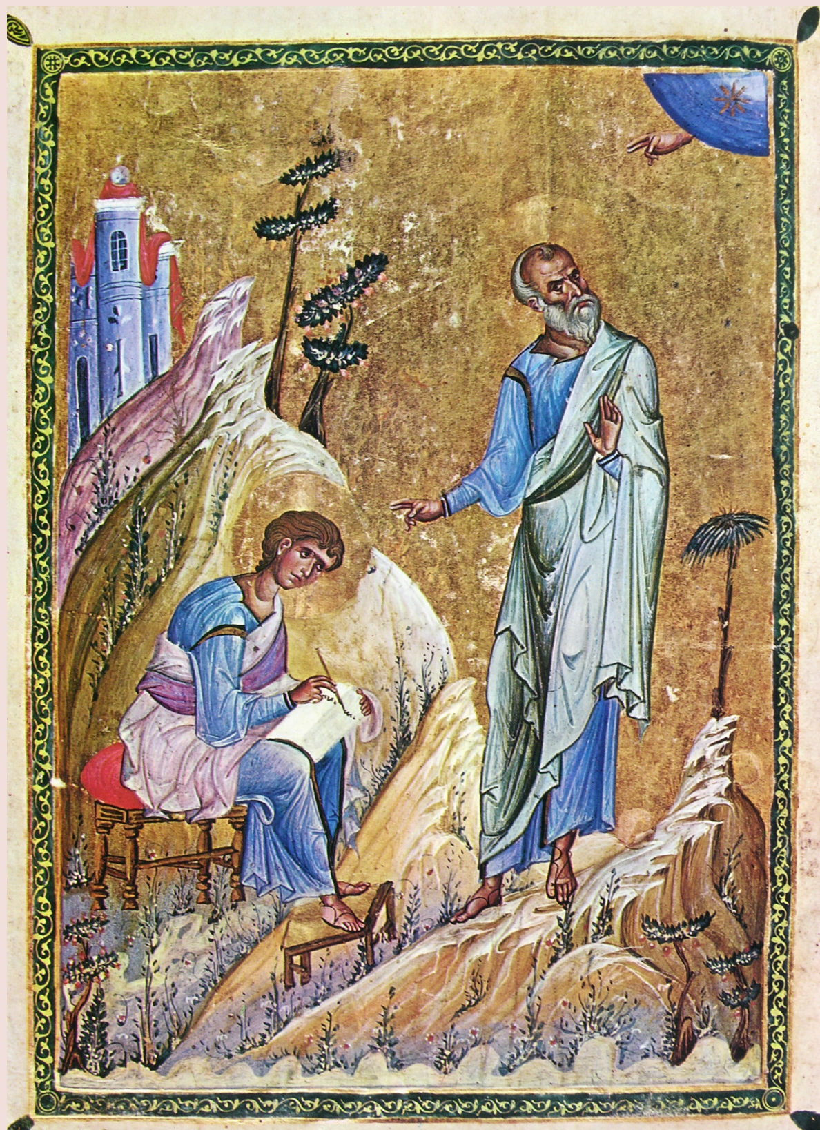
Апостол Иоанн Богослов и Прохор на острове Патмос. Миниатюра Евангелия. Монастырь Дионисиат, Афон. Середина XI века