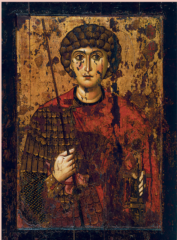
Св. Георгий. Успенский собор Кремля. XI век.

матери, в палестинский город Лиду, где позднее над его гробницей был построен православный храм.