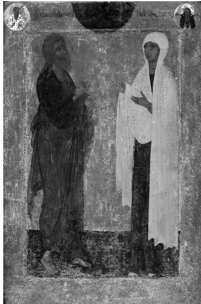
Святые Симеон и Анна. Сер. XVI века, частное собрание

Теперь Симеон мог спокойно вступить во врата вечности – его очи увидели спасение мира, увидели Свет, явившийся для просвещения язычников, увидели Славу народа израильского. Уверенность в непреложности обетования, надежда на своё личное спасение, на спасение своего народа и всего человечества вылились в его боговдохновенном исповедании веры в пришедшего Спасителя, в его чудных словах, которые Святая Церковь повторяет каждый день за вечерним богослужением: «Ныне отпускаеши раба Твоего, Владыко, по глаголу Твоему, с миром, яко видеста очи мои