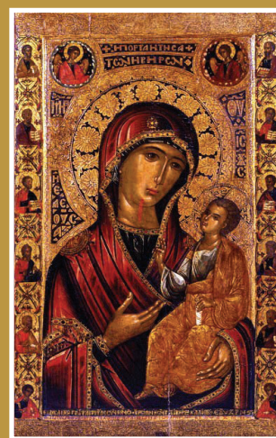
Иверская икона Богоматери, иконописец иером. Ямвлих, 1648

В этом выпуске: 3-я годовщина нтронизации Святейшего Патриарха Московского и всея Руси Кирилла