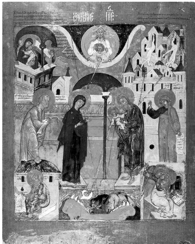
Сретение Господне. Кон. XVI века, Ярославский музей

В ночь перед выходом израильтян из Египта, Ангел Господень умертвил всех первенцев египетских, а еврейских оставил невредимыми. В благодарность Богу за спасение от рабства евреи должны были посвятить Ему своих первенцев, которые становились собственностью Божией и служили