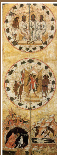
Дверь в жертвенник, кон. XVI века

Над выпуском работали: дизайн и верстка - Владимир Бабич, редакторы- Елена Саенкова, Ольга Лисицина, фотографии - Олег Зуев