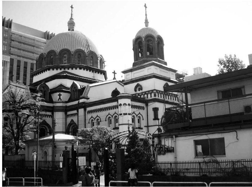
Кафедральный собор Воскресения Христова в Токио

В 1884 году началось строительство православного храма на холме Суругадай, который был куплен у японского правительства для русской миссии. 24 февраля 1891 года храм был торжественно освящен. В этот день впервые на глазах всей Японии, во всей красе православного богос-