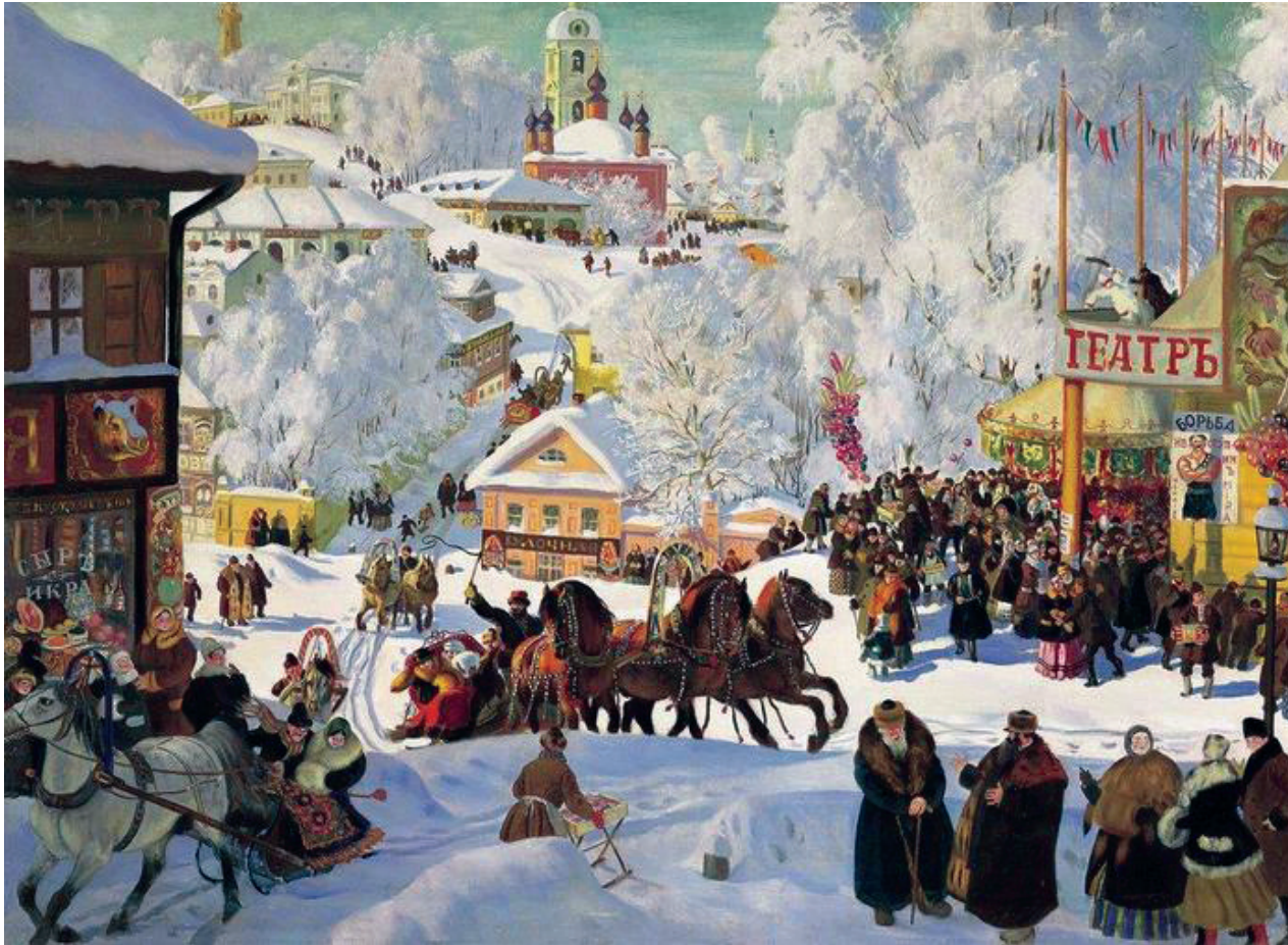
Борис Кустодиев. Масленица, 1919

Именно преподобные отцы и жены, «Цветы райские», «стяжавшие плоды духовные», посылают нам, грешным, с небес своё благословение перед Прощёным воскресеньем. В субботу Сырной седмицы причащаются святых Христовых Таин все иноки, монахи и схимники, давшие обет «плоть распять со страстями и похотями» ради Господа нашего, Иисуса Христа. Эти благочестивые люди на протяжении всей своей жизни имеют многие ограничения и обязательства перед Богом ради своего спасения и спасения всего мира, за который они ежедневно молятся, выполняя своё келейное Правило.