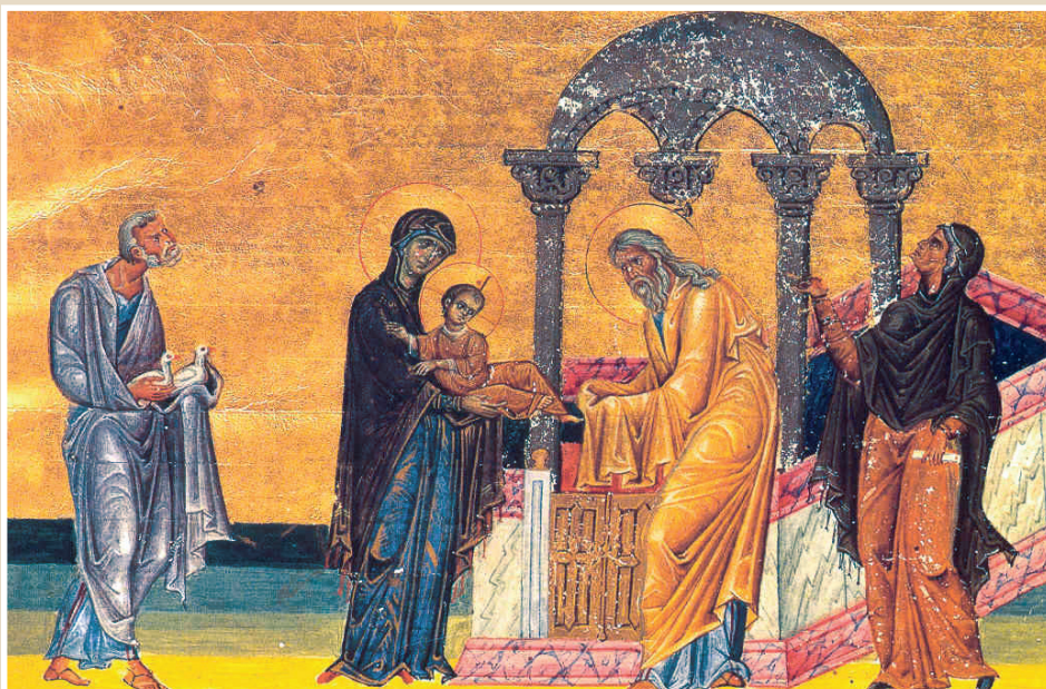
Миниатюра Миналогия императора Василия II, кон. X века