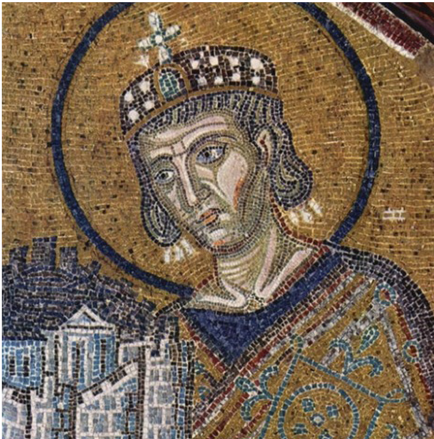
Святой равноапостольный император Константин